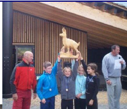
Le trophée équipe 1

Rendez-vous pour la remise en jeu du trophée.