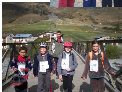
3èmes équipe 2