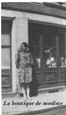
La boutique de modiste

*Au Molliet, 2 cafés (Domeignoz et Sandraz) et une épicerie (Chapellet) où fut installé le premier téléphone public.