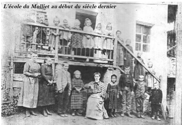
L'école du Molliet au début du siècle dernier

*On revenait avec les oreilles en sang ; on prenait des coups de règle sur les doigts ; on restait des heures à genoux sur une règle...sans oublier le bonnet d'âne !